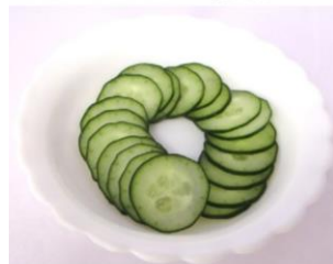
キュウリの輪切り