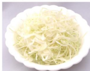
キャベツの千切り