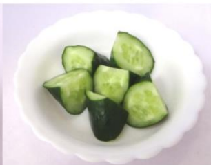
キュウリの乱切り