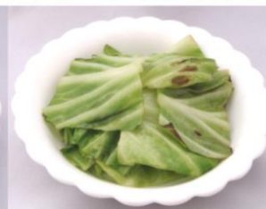
キャベツの炒めもの